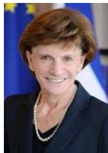
Michèle Delaunay, ministre déléguée auprès de la ministre des Affaires Sociales et de la Santé, chargée des Personnes âgées et de l'Autonomie