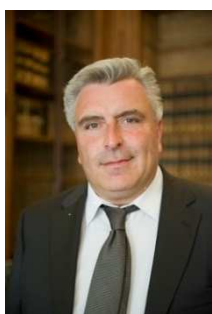
Frédéric Cuvillier, ministre délégué auprès du ministre de l'Ecologie, du Développement durable et de l'Energie, chargé des Transports, de la Mer et de la Pêche