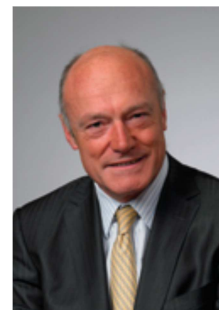
Alain Rousset, président du Conseil régional d'Aquitaine