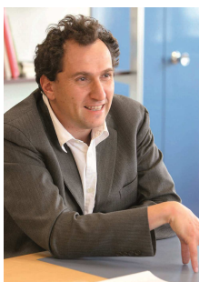
Vincent Feltesse, président de la Communauté urbaine de Bordeaux