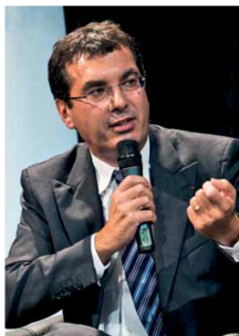
Jean-Pierre Farandou, président du GIE Objectif transport public